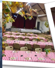
La soirée Beaujolais - 105 personnes Le 18 novembre 2023