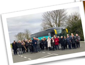
Le repas des aînés(es) - Sortie Diamant Bleu Avec 47 aînés(es) - Le 3 décembre 2023