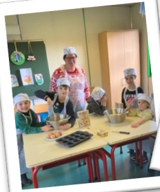
La garderie du mercredi 2023 Avec 8 enfants