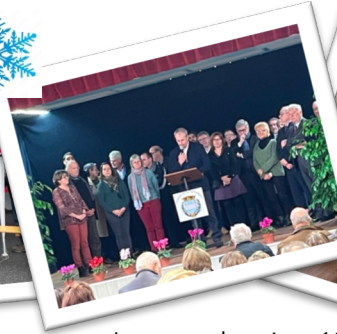
Les vœux du maire - 160 personnes Le 19 janvier 2024