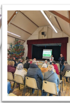
Réunion sur la loi APER Le 20 janvier 2024