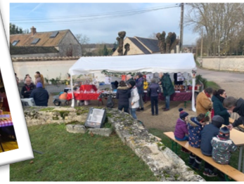
Le marché de l'Avent Le 26 novembre 2023