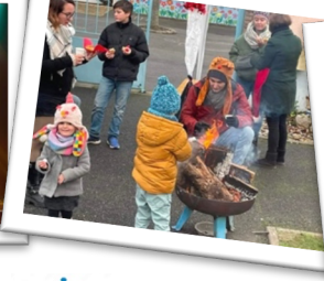
Le vin chaud Le 17 décembre 2023