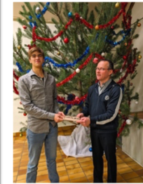
La remise du brevet & du bac Mentions Très Bien