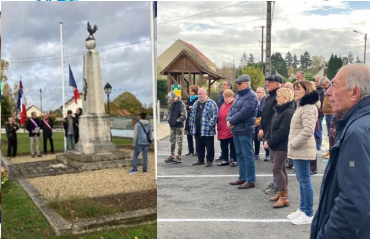
Cérémonie du 11 novembre 2023 Avec nos nonvillois